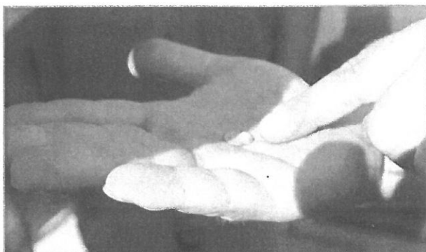
MINCE. Archeologové měli při jejím nálezů důvod k radosti. Byla ražena za krále Jana Lucemburského.

I nformace o probíhajícím archeologickém výzkumu a ukázka cenných artefaktů vzdálené historie, které byly při něm objeveny na severním nádvoří a při jihovýchodní části baziliky Nanebevzetí Panny Marie na Velehradě, přilákaly v jednom z červnových poledních bezmála stovku občanů Velehradu, Modré a okolních vesnic.