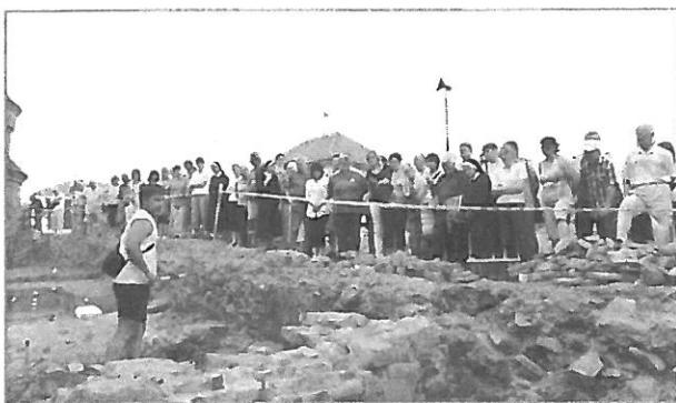
VE VÝKOPU. Odkryté základy koridoru možná viděli lidé naposled. Po průzkumu bude zahrnutý.